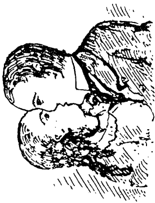
"De unga två"